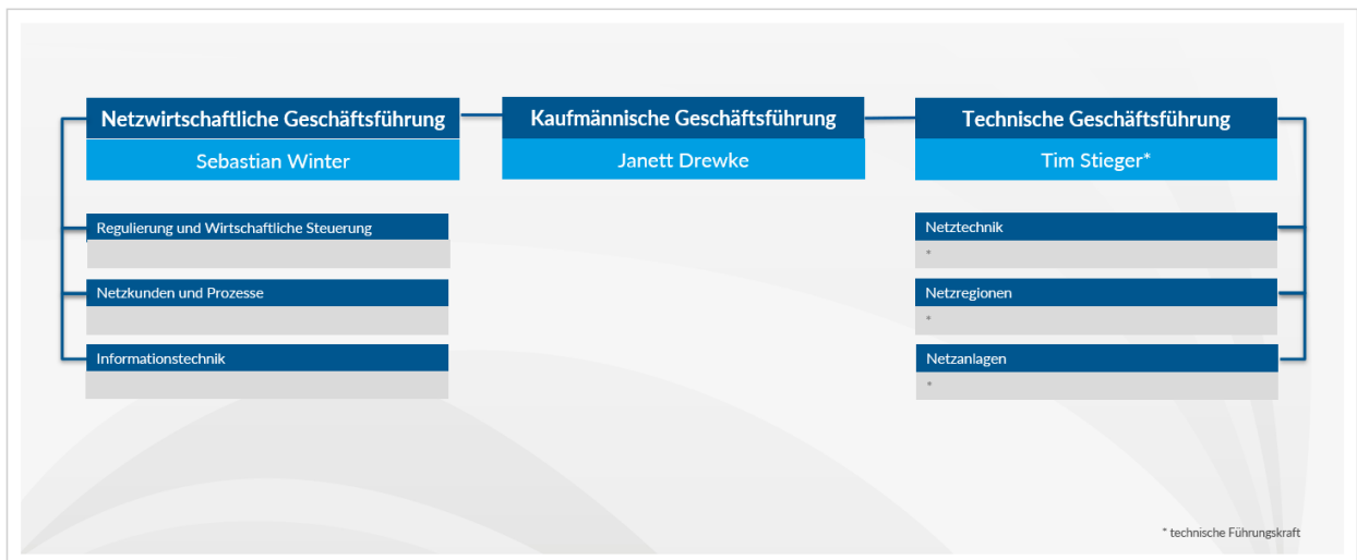
Abbildung 2: Organigramm WEMAG Netz GmbH (Stand: 31.12.2025)